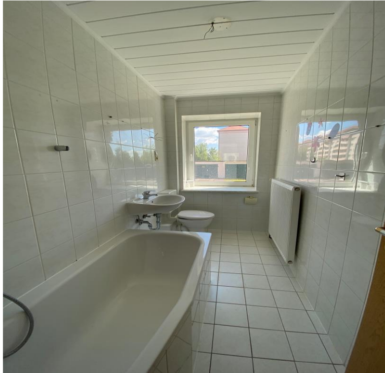
Bad/WC mit Badewanne